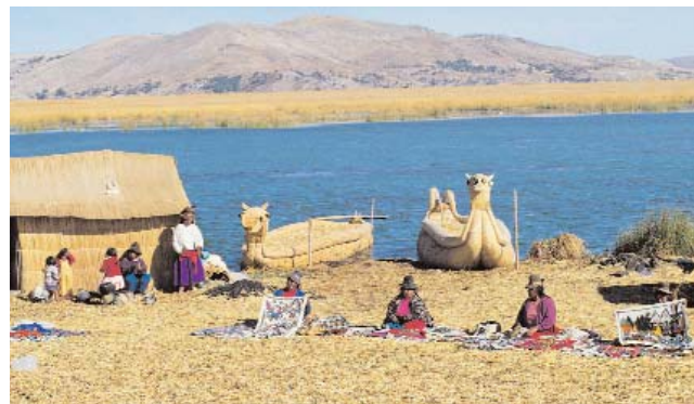
Isla Los Uros, Lago Titicaca. / The Uros Island, Titicaca Lake.