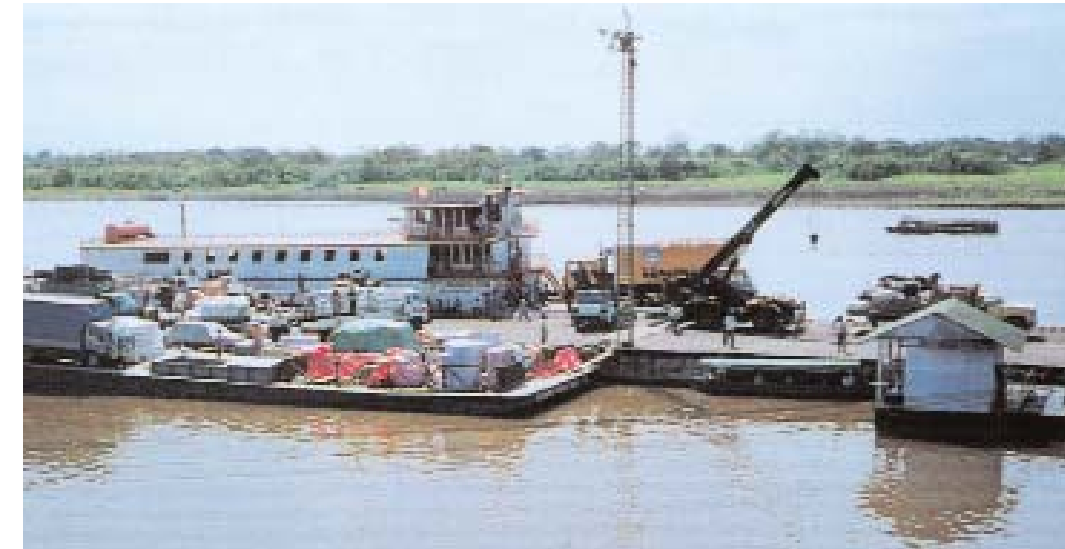
Vista parcial del Puerto de Iquitos. / Iquitos Port Partial View.