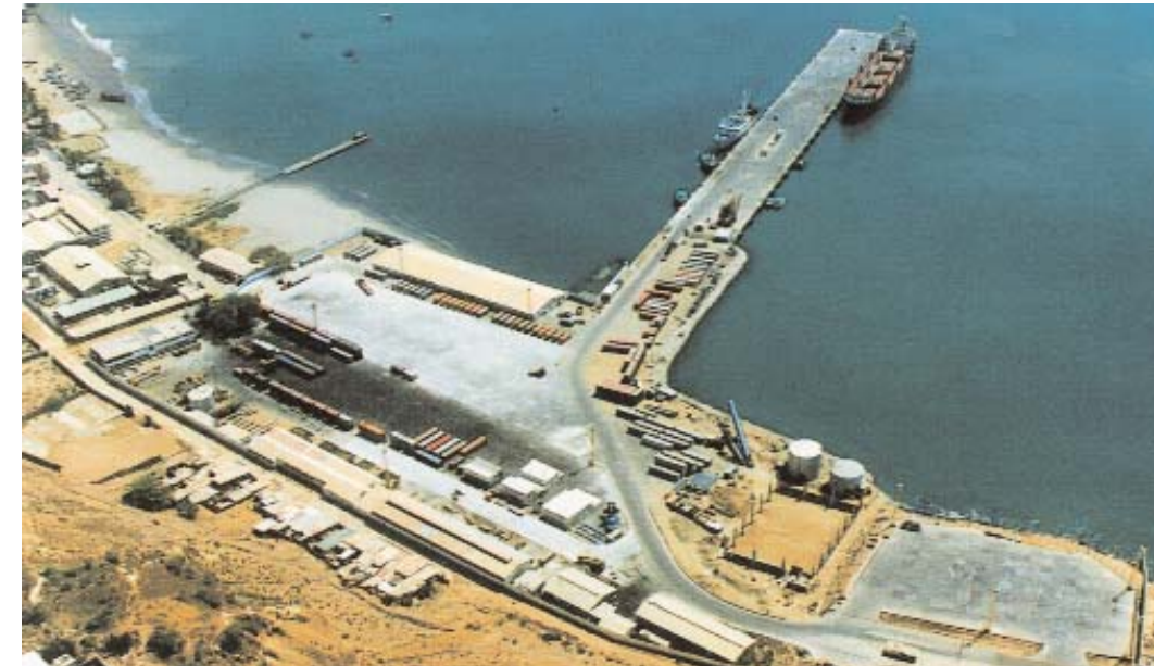
Vista aérea del Puerto Paita. / Paita Port air view.